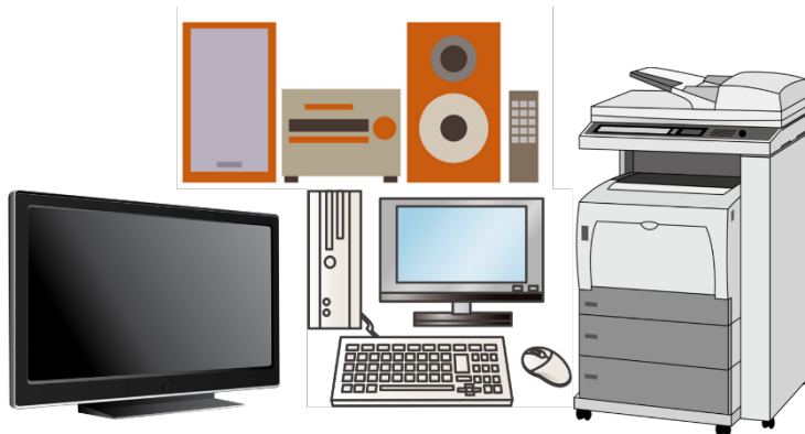
I小委員会（情報技術装置・マルチメディア機器及び放送受信機の妨害波・妨害耐性に関する規格を策定）

I小委員会では、情報技術装置、マルチメディア機器及び放送受信機の妨害波（エミッション）及び妨害耐性（イミュニティ）に関する許容値及び測定法の国際規格の制定・改定を行っている。I小委員会には、第7メンテナンスチーム（MT7）及び第8メンテナンスチーム（MT8）が設置されており、MT7はエミッション要求事項（CISPR 32「マルチメディア機器の電磁両立性－エミッション要求事項－」等）を、MT8はイミュニティ要求事項（CISPR 35「マルチメディア機器の電磁両立性－イミュニティ要求事項－」等）を担当している。なお、画像劣化の客観的な評価法（CISPR TR 29「テレビ放送受信機ならびに関連機器－イミュニティ特性－客観的な画像評価法－」）を所掌している第9メンテナンスチーム（MT9）は、令和3年11月に開催されたI小委員会総会Web会議での決定に基づき、CISPR TR 29第2版の発行をもって解散した。