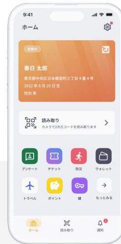
デジタル身分証とミニアプリ

例) 防災・避難支援 電子チケット 地域向け広告・アンケート メッセージャー・SNS