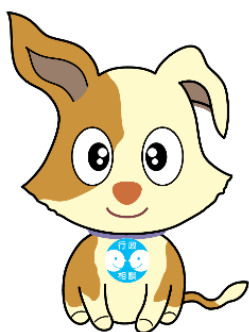
行政相談のマスコット キクーン

また、行政相談委員全体会議に引き続いて開催される群馬行政相談委員協議会総会において、行政相談委員活動に関し顕著な功績のあった 委員1名に全国行政相談委員連合協議会会長表彰 が贈呈されます。