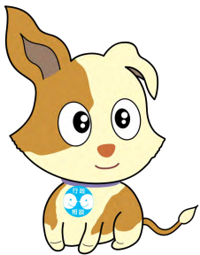
行政相談のマスコット キクーン