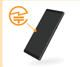
スマートフォン等では、液晶画面に表示される場合もあります