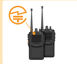
トランシーバー：裏面または内蔵バッテリーを取り外した部分