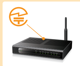
無線LAN 据え置き型の機器：裏面

多くの場合、無線機器の型式名称や製造者が記載された銘板や外箱に表示されています。