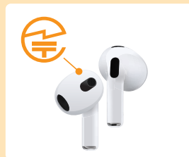
ワイヤレスイヤホン：本体やタグなど