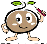
マスコットキャラクター 「つっちー」