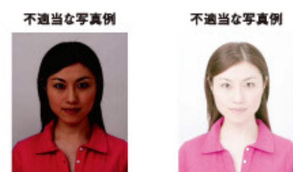
露出不足（露出アンダー） 露出過多（露出オーバー）

サングラスやヘアバンド以外にも、顔の器官が隠れるような帽子や衣服、布などの大きめの装飾品等は不適当です。