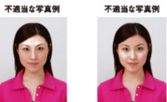
額に過度のテカリがあるもの 頬などに過度のテカリがあるもの

額、頬などに過度のテカリがあるものについては、免許証の写真が変色する場合がありますため不適当です。