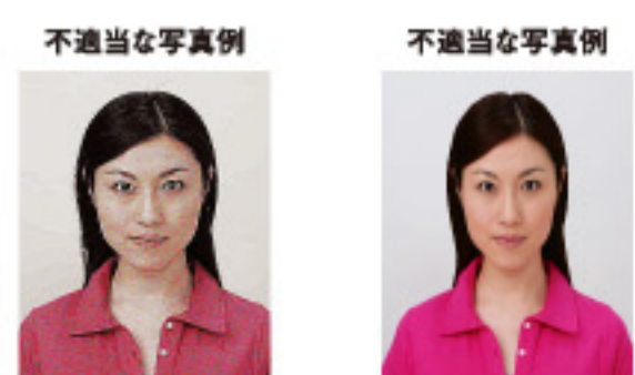
ノイズがあるもの 画像処理を施したもの

画像ファイルの過剰な圧縮等が原因となってノイズ（画像の乱れ）が発生しているもの、変形やマスキング（縁取り）などの画像処理を施したものは不適当です。