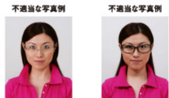
眼鏡のフレームが目にかかっているもの フレームが非常に太く目や顔を覆う面積が多いもの

眼鏡のフレームが目にかかっているものやフレームが非常に太いものなどは不適当です。