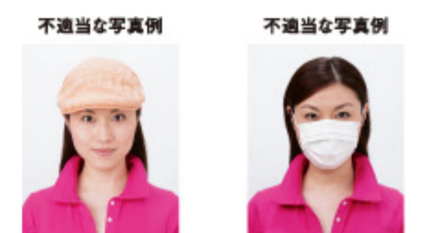
帽子によって顔が隠れているもの マスクで顔の下半分が隠れているもの

サングラスやヘアバンド以外にも、顔の器官が隠れるような帽子や衣服、布などの大きめの装飾品等は不適当です。