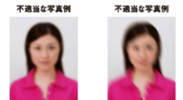
ピンぼけにより不鮮明なもの 手ぶれにより不鮮明なもの

撮影時にピントが合っていないかたり、手ぶれしてしまったために画像が不鮮明なものは不適当です。