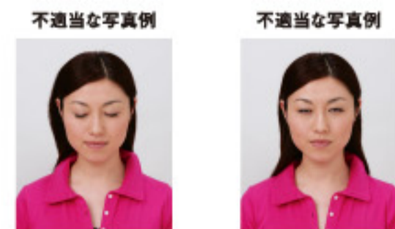
目をつぶっているもの 目をはっきりと開けていないもの

撮影時にピントが合っていないかたり、手ぶれしてしまったために画像が不鮮明なものは不適当です。