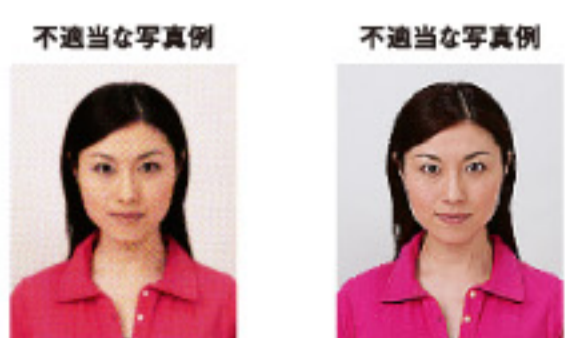
ドットやインクのにじみなどがあるもの ジャギーがあるもの

デジタル印刷の場合、ドット（網状の点）やジャギー（階段状のギザギザ模様）、インクのにじみなどがみられるものは不適当です。