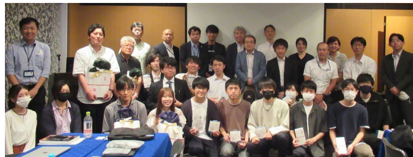
<交流会の様子 (参加者と協力企業等の集合写真) >