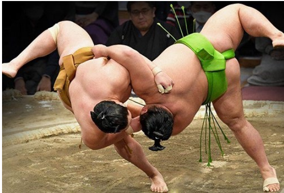
【公式ウェブサイト・アプリ】 「大相撲」は、公式ウェブサイト・アプリの中で最も人気が高いコンテンツのひとつ