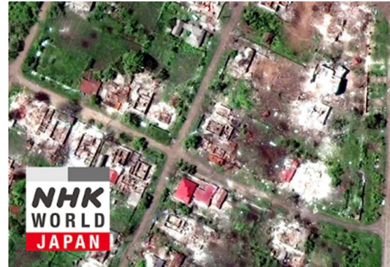
【外部プラットフォーム】 「Digital Eye - Ukraine」はYouTubeで440万回再生されておりCNNなどからの流入も多い