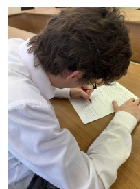
ワークシートを添削するJET-ALT