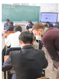
英語の授業の様子