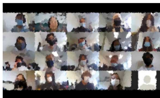
アメリカから送られた動画の1シーン