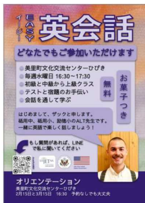
「EASY英会話」のポスター