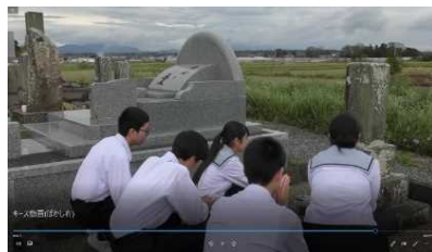
木花中学校区の紹介動画リンク (QRコード)