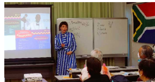
南アフリカ出身JET-ALTによるセミナー