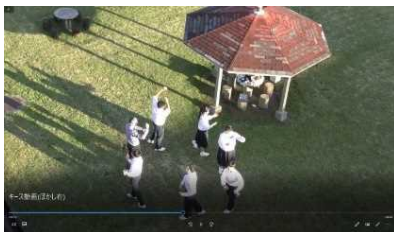
久峰中学校区の紹介動画