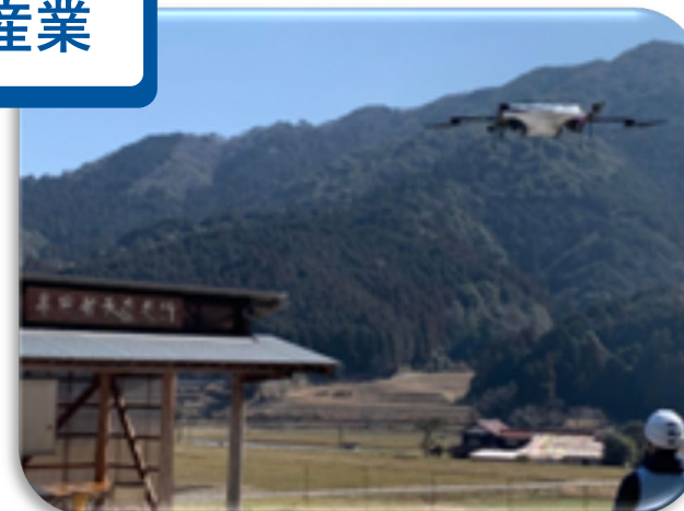
ドローンを活用したスマート物流