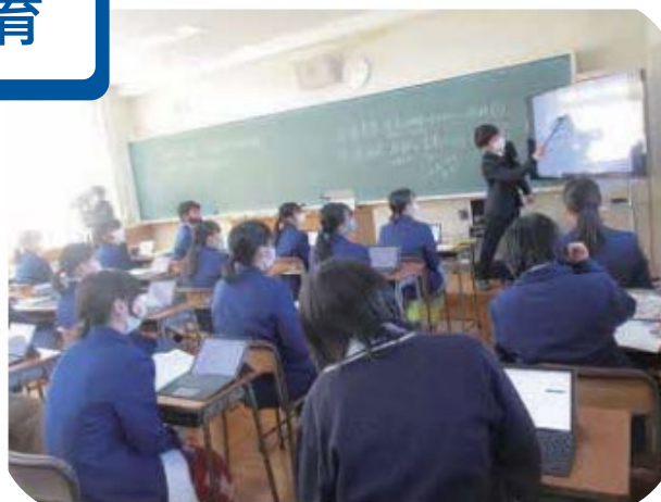
G I G A スクール構想の推進