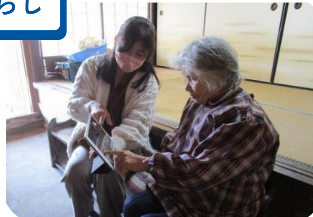
地域におけるデジタル機器の活用