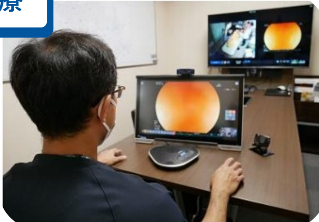
デジタル技術を活用した遠隔診療