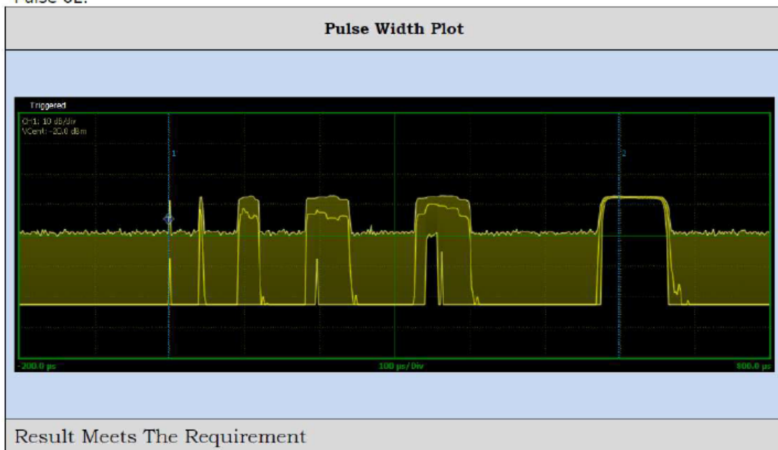
図3.1-1 複数のPON電波及びQON電波を送信する例