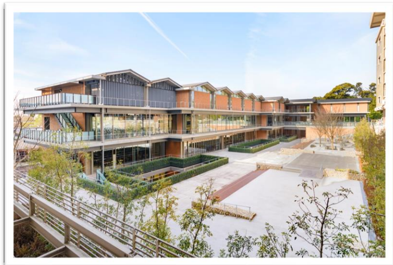
京都女子大学 東山キャンパス