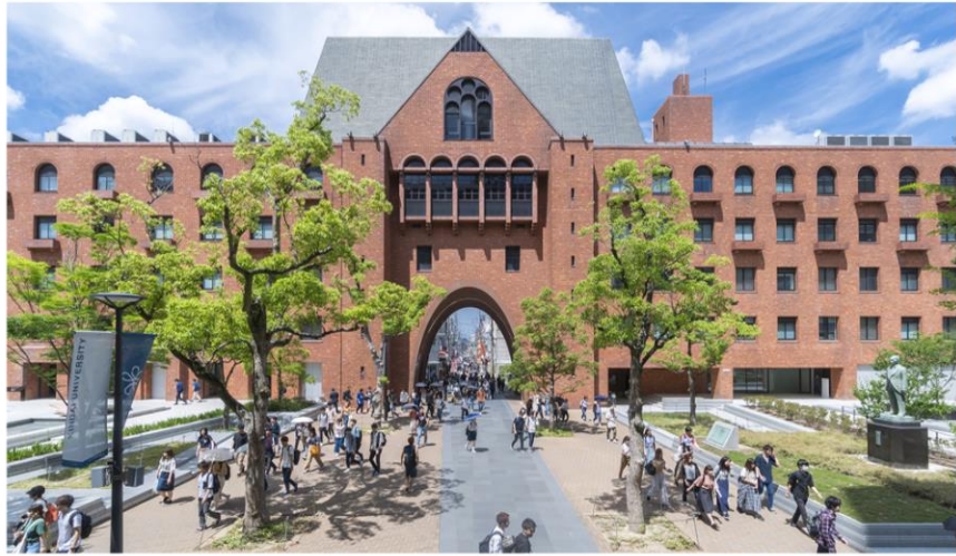
近畿大学 東大阪キャンパス