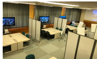
次世代の学習環境の整備