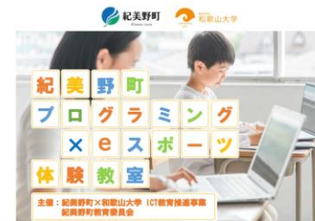
連携講座のチラシの例(抜粋)