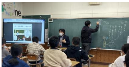
情報モラル指導(上) プログラミング等の授業(右)