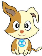
行政相談マスコット キクーン