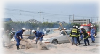
災害復旧作業時の連絡