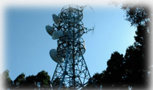
防災行政無線設備の被災