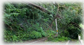
孤立集落との情報連絡