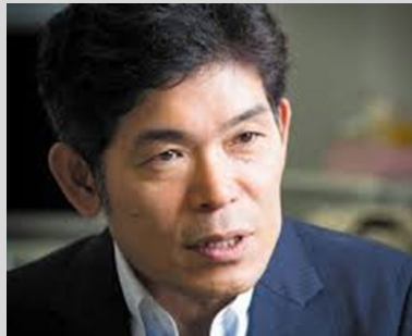
柳川範之 東京大学大学院 経済学研究科 教授