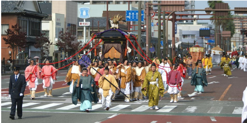
宮崎神宮大祭（神武さま）