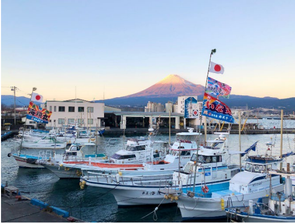
田子の浦港からの富士山（秋期）