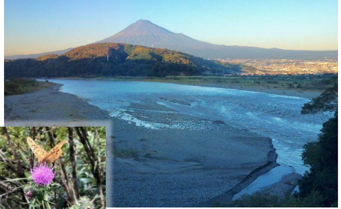
富士山麓のヒョウモンチョウとフジアザミ [写真左] 富士川右岸から望む富士山（夏期） [写真右]