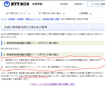
図1. 自前工事実施可能な工事会社の基準 [1]

○ NTT 東日本の通信用建物において指定業者によらない自前工事を行うためには、以下の2要件のいずれかが必要であるとされている。