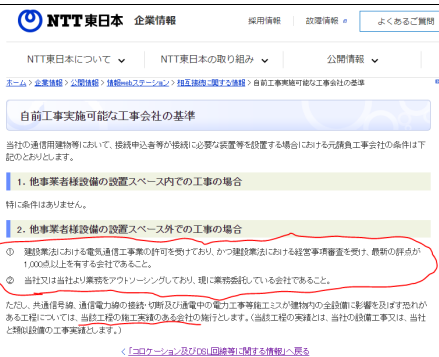
図1. 自前工事実施可能な工事会社の基準 [1]

○ NTT 東日本の通信用建物において指定業者によらない自前工事を行うためには、以下の2要件のいずれかが必要であるとされている。