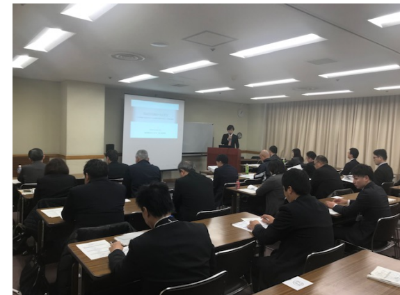
セミナー会場の様子