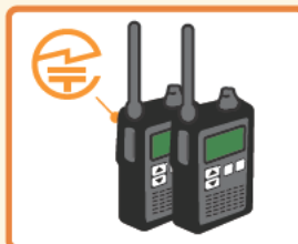
トランシーバー:裏面または内蔵バッテリーを取り外した部分