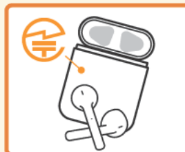
ワイヤレスイヤホン:本体や外箱など