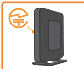
無線LAN 据え置き型の機器:裏面