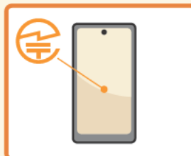
スマートフォン等では、液晶画面に表示される場合もあります