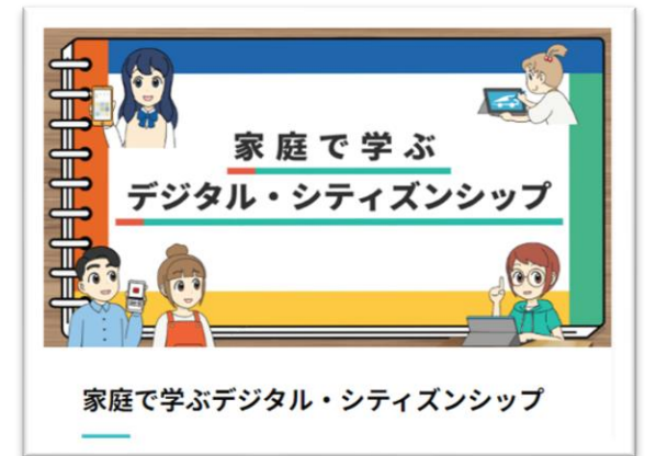
家庭で学ぶデジタル・シティズンシップ