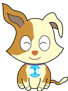
行政相談マスコット キクーン

令和 6 年度、奈良県内の行政相談委員は、延べ 589 回、相談所を開設しました。