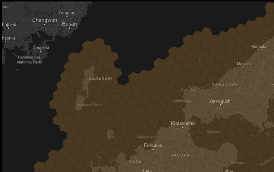
他国へ干渉を与えない制限値を考慮した場合のビーム設定イメージ