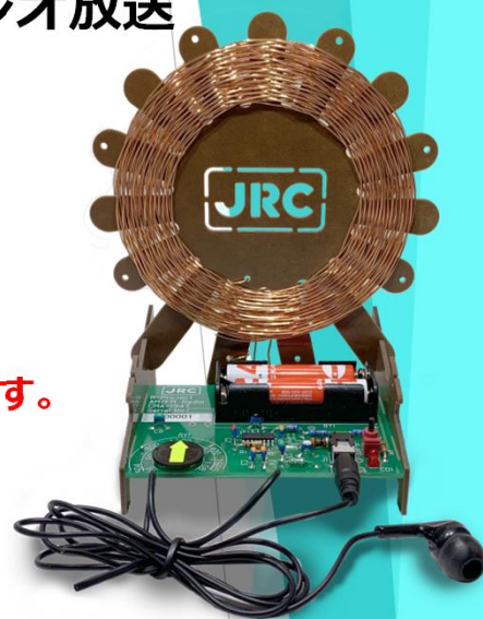
ワイドFM対応 AM/FMラジオ ラジオはもらえるよ！