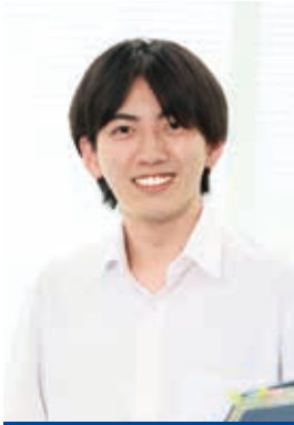
無線通信部 無線通信課

そんな入局して間もない4名に、四国総合通信局を志望した理由や職場の雰囲気について聞いてみました。