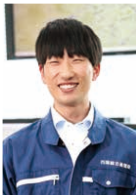
電波監理部 監視調査課