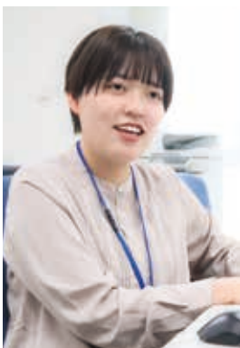
情報通信部 情報通信振興課

皆様の将来の選択肢の一つとして、四国総合通信局が少しでも頭をよぎると幸いです。まずは業務説明会等で庁舎に足を運んでいただき、実際の雰囲気を肌で感じてみてください。このパンフレットを読んでくださっているあなたと出会えるのを心待ちにしています！