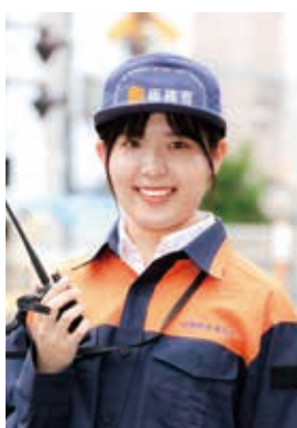
無線通信部 無線通信課

国家公務員の中でも四国総合通信局はどのような業務を行っているか印象を持ちにくいかもしれませんが、私自身、理系出身ですが電波についての知識は全くありませんでした。少しでも不安や疑問があれば気軽に業務説明会に参加し、質問していただくと良いと思います。そして、四国総合通信局に興味を持っていただければ幸いです。