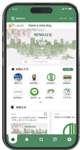
※SENDAIポータル画面イメージ