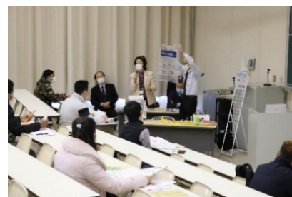
(行政相談出前教室)