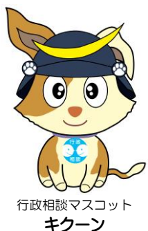
行政相談マスコット キクーン