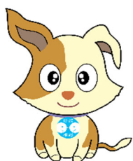
行政相談マスコット 「キクーン」