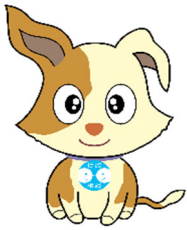
行政相談マスコット 「キクーン」