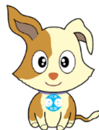
行政相談マスコット キクーン

相続・遺言・税金・登記・労働・保険 など 生活全般について何でもご相談いただけます。 お気軽にお越しください！