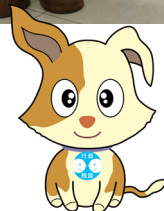
行政相談キャラクター キクーン