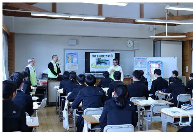
《令和 5 年度の行政相談出前教室（今治市立朝倉中学校）開催風景》