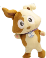
行政相談マスコット 「キクーン」