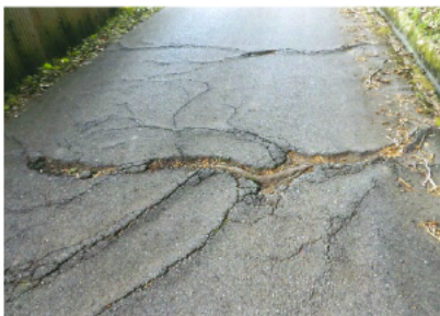
▲木の根が浮き上がり道が凸凹で自転車を通る際に危険！

出前教室では、生徒からの困りごと（相談）も受け付けており、これまで出前教室で受け付けた相談の中には、次のように改善に結びついたものもあります。