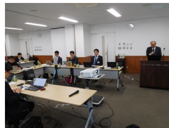
＜アドバイザー制度の現状報告＞