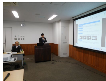
＜活用自治体事例紹介 (中讃広域行政事務組合様)＞