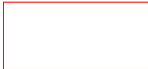
dポイントクラブ会員の属性