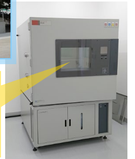
温度・湿度 試験設備