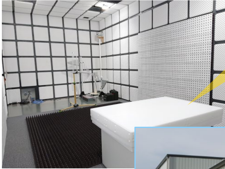
機器にノイズを当てる試験設備