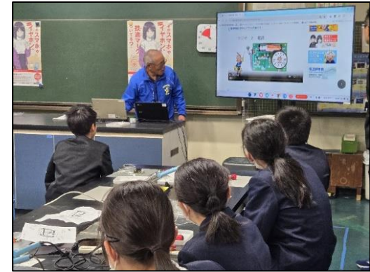
【ビデオ学習の様子】

その後、電波を身近に感じてもらうためAMラジオの製作を児童自らが実施しました。実施に当たっては、最初に「はんだ付けeラーニング（DVD）」を視聴し、はんだ付けに苦戦する児童には、電波適正