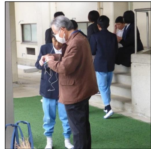
【完成したラジオで聴取する様子】