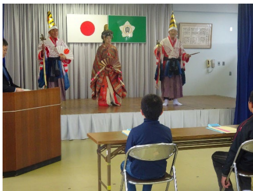
穴井歌舞伎の紹介 (当時は衣装の紹介のみ)