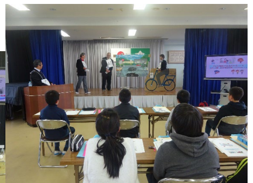
寸劇による解決事例の紹介