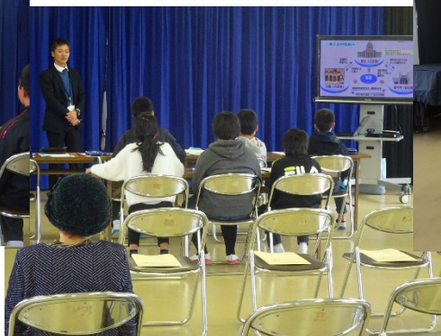
行政相談出前教室での行政の説明