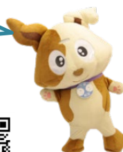
行政相談マスコット 「キクーン」