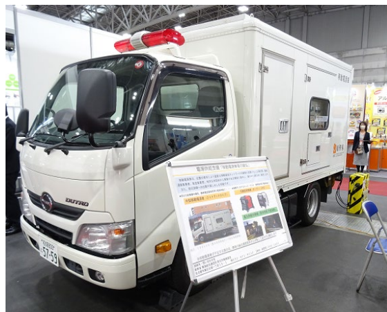
移動電源車の展示