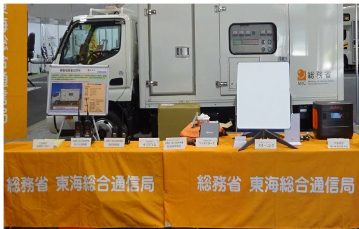
移動通信機器等の展示