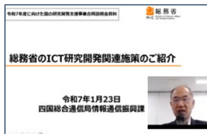
＜四国総合通信局からのご紹介＞