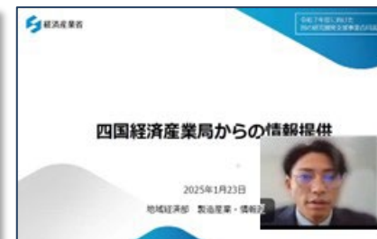
＜四国経済産業局からのご紹介＞