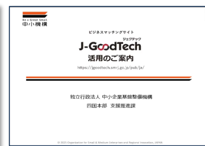
＜中小企業基盤整備機構からのご紹介＞