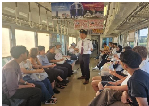
地元鉄道会社へのヒアリングの様子