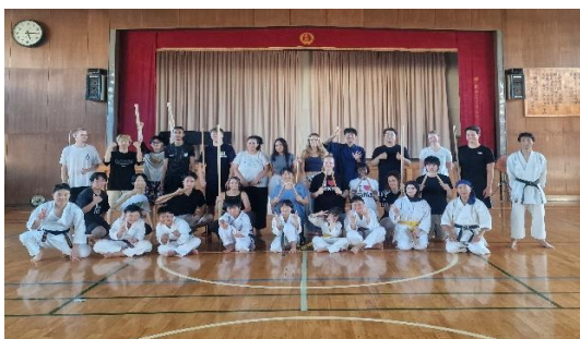
地元小学校での武道を通じた多文化交流の様子

地元の人たちと一緒に、グローバルな視点で、日本・世界の老若男女を巻き込んだまちづくりに取り組んでいます。