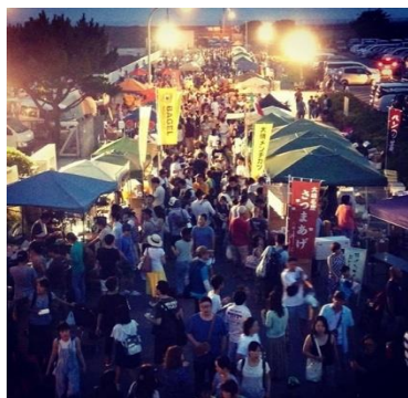
夏の大磯市の様子

神奈川県大磯町を拠点に、地域遊休資産(空き家・空き店舗・農地・公共施設)を活用し、エリアの魅力を高めるプロジェクトを推進している。地域のインキュベーション(県下最大の朝市「大磯市」の運営)、里山再生(コミュニティ農園「大磯農園」の運営) 空き家空き店舗再生(団地再生、6次産業化、カフェ、立ち飲み、本屋、雑貨店、パン屋の運営)、働き方改革(森のようちえん併設コワーキングスペース「Post-CoWork」の運営)などローカルエコシステムの再構築に取り組むとともに関係人口の創出や多世代コミュニティの形成にも貢献しています。