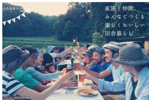
週末田舎暮らしを楽しむ農園メンバーたち