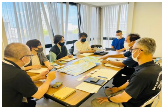
観光庁観光DX事業でのコンテンツ造成 (今治市)

農泊、民泊や交通施策、プロモーション、ボランティアツーリズム、古民家再生、ICTを使ったCRMの確立やEBPM施策の実行、観光地域通貨の導入、体験商品の造成、エコツーリズム、ワーケーションを代表とするMICEの取り組み、ふるさと納税の増大など、現在は自治体と地域事業者、DMOをつないでそれぞれの立場においての合意形成を行なっています。